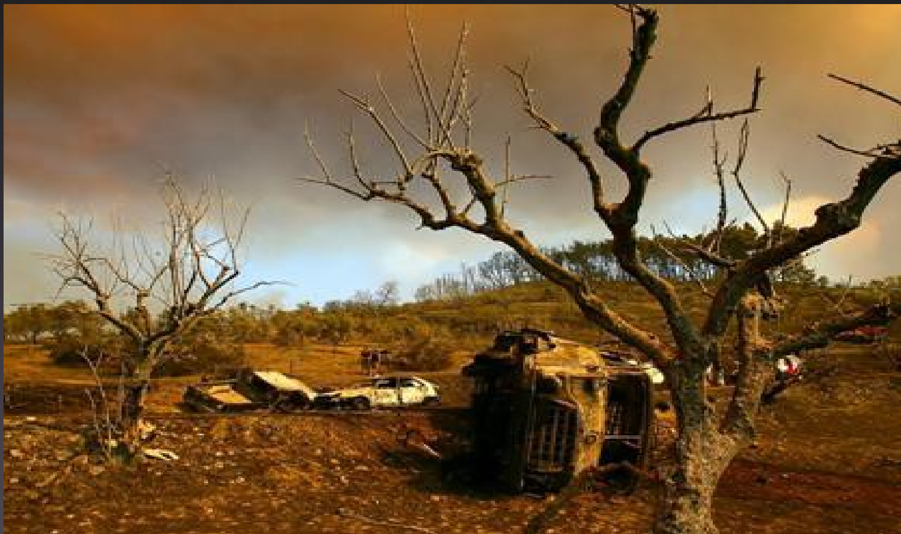
Αρτέμιδα 2007 - Ηλεία